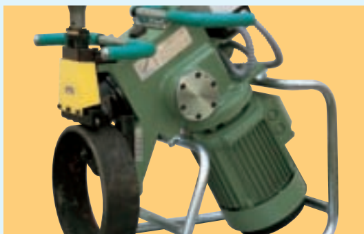
Vista de la máquina realizando la operación de chaflanado en tubos de distinto tamaño. View of the machine beveling tubes of different sizes. Vue de la machine en train de réaliser l'opération de chanfreinage sur des tubes de taille différente.