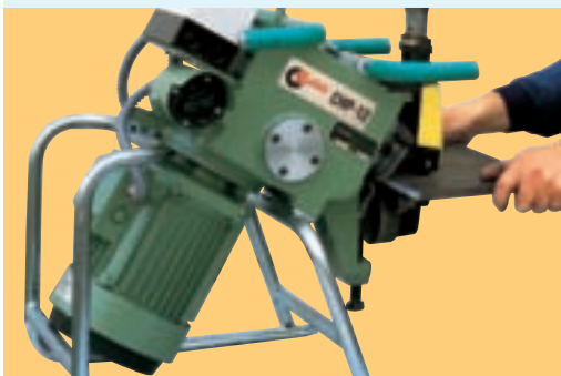
Ejemplo de chaflanado de piezas pequeñas multiformes. Examples of beveling multi-form little parts. Exemples de chanfreinage de petites pièces multiformes.